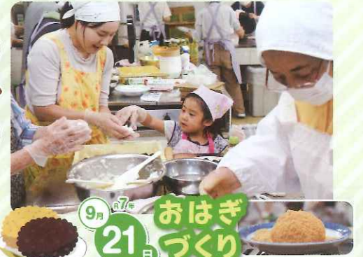
9月21日 おはぎづくり