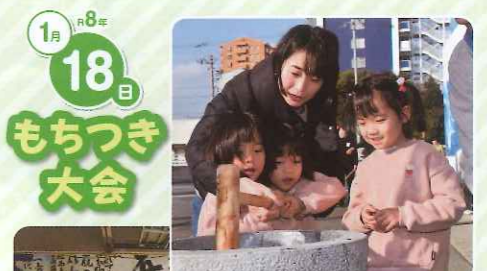
1月18日 もちつき大会