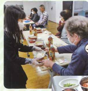
11月21日 高齢者給食会